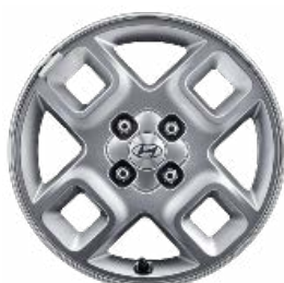
15" könnyűfém keréktárcsák Prime