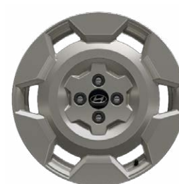
17" könnyűfém keréktárcsák INSTER Cross