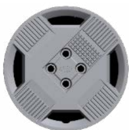
15" acél keréktárcsák Comfort