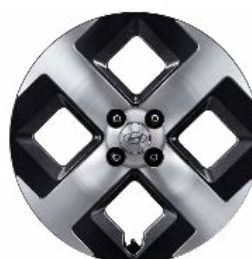
17" könnyűfém keréktárcsák Prime