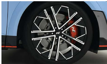
21" kovácsolt könnyűfém keréktárcsák, Pirelli gumiabroncsokkal