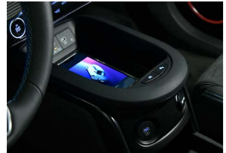
Vezeték nélküli telefontöltő, USB-C csatlakozók