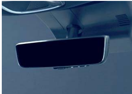
Digitális belső visszapillantó tükör