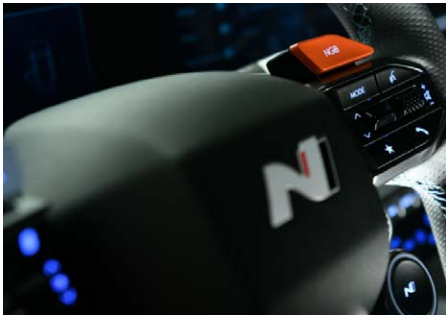
Dedikált N bőrkormány