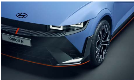
Dedikált Hyundai N első lökhárító