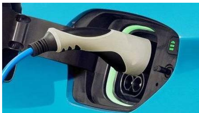
Fűthető elektromos töltőnyílás