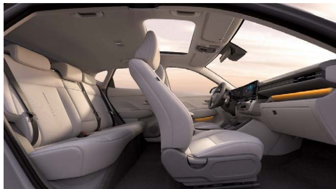
Vékony ülések és tágas belső tér