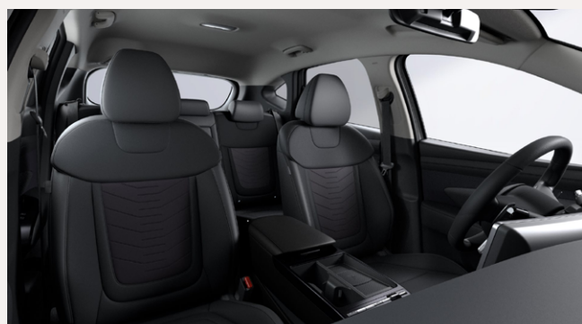
Obsidian Black (Bőr/Szövet) - NNB