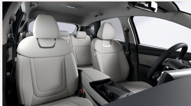
Moss Gray (Bőr) - MMH