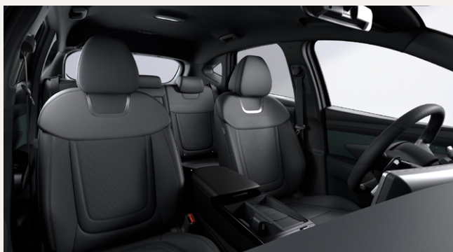
Cypress Green Color Pack (Bőr) - NJG