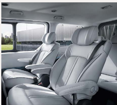
Luxury 7 személyes