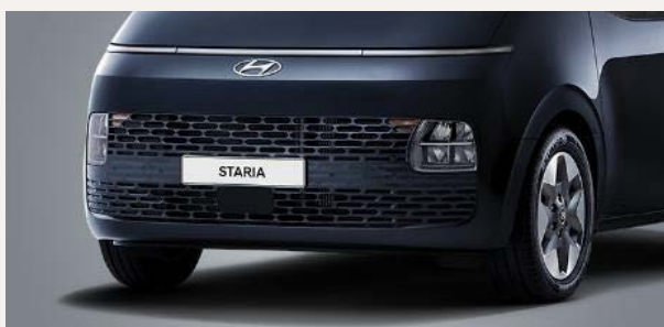
Comfort 9 személyes