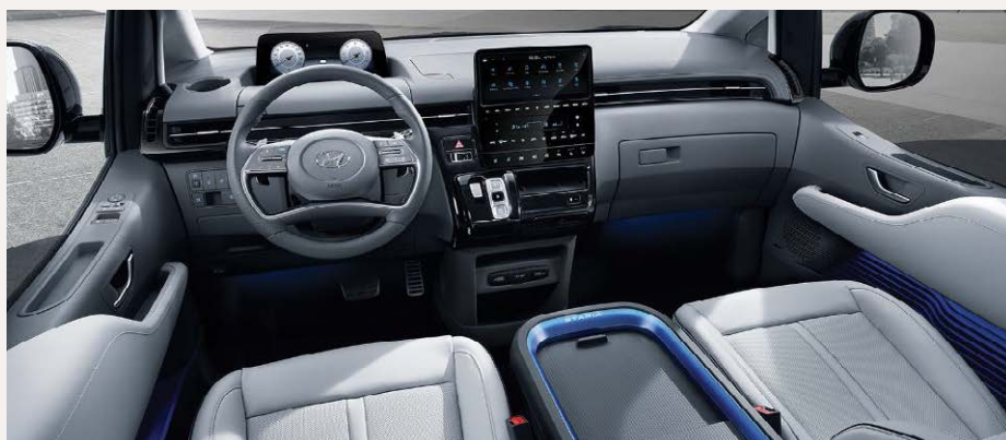
Luxury 7 személyes