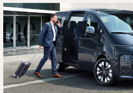
Elektromosan csúsztható ajtók