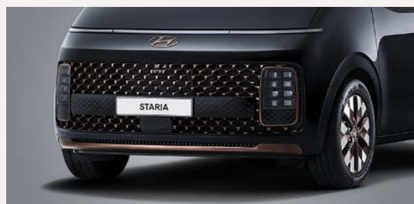
Luxury 7 személyes