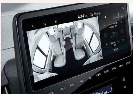
Audióvizuális kapcsolattartás a hátsó utasokkal