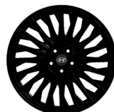
21" könnyűfém keréktárcsák Executive Black Ink csomag