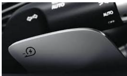
Intelligens regeneratív rendszer 3.0