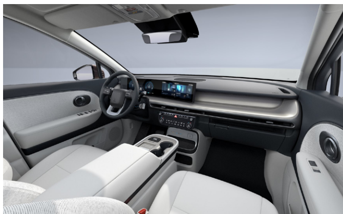
Obsidian Black/Dove Gray (Szövet)