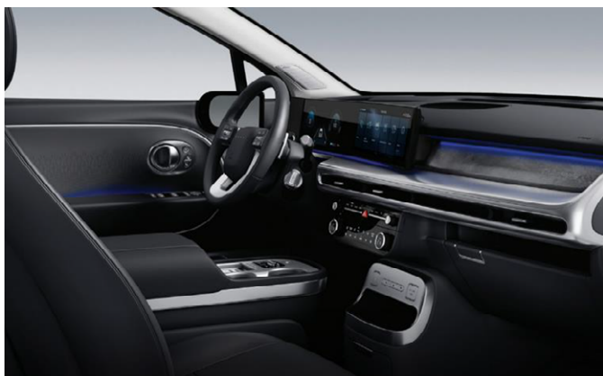
Obsidian Black (Nappa bőr)