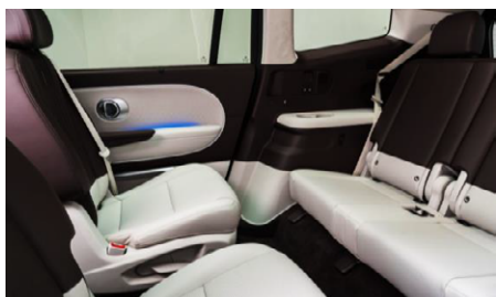
Második sorú forgatható ülések (6 üléses változatnál)