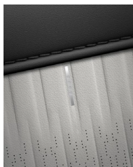
Obsidian Black & Dove Gray