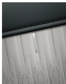
Dark Teal & Dove Gray