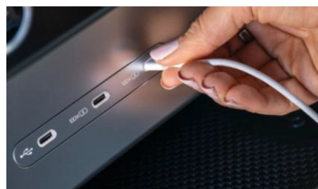
6db nagy teljesítményű USB-C csatlakozó (akár 100W)