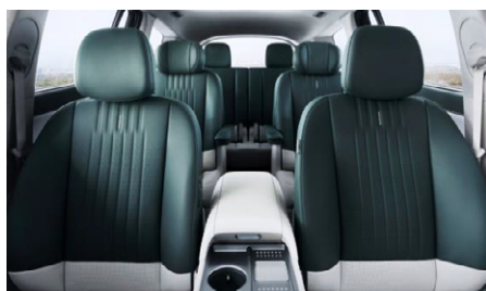
Nappa bőr prémium kárpitozás