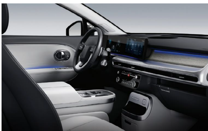
Obsidian Black/Dove Gray (Nappa bőr)