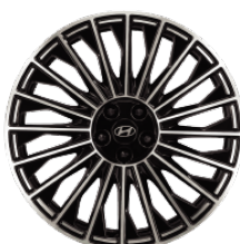
21" könnyűfém keréktárcsák Executive