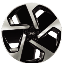
19" könnyűfém keréktárcsák Prime