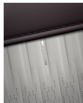
Dark Wine & Dove Gray