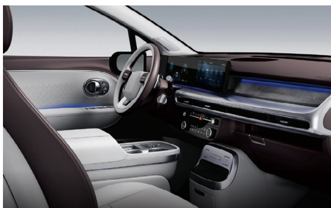
Dark Wine/Dove Gray (Nappa bőr)