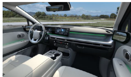
Tágas és praktikus belső tér