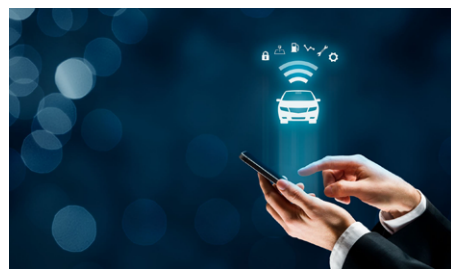
Digitális kulcs 2.0