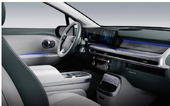
Dark Teal/Dove Gray (Nappa bőr)