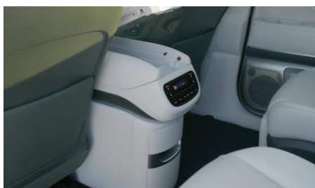
Universal Island 2.0 középkonzol