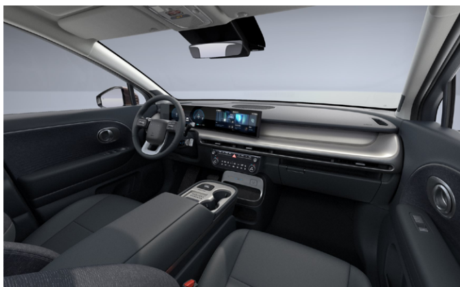
Obsidian Black (Szövet)