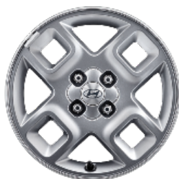
15" könnyűfém keréktárcsák Prime