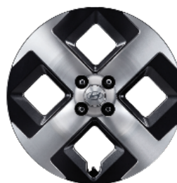
17" könnyűfém keréktárcsák Prime