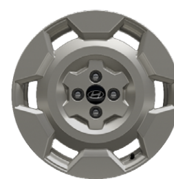
17" könnyűfém keréktárcsák INSTER Cross