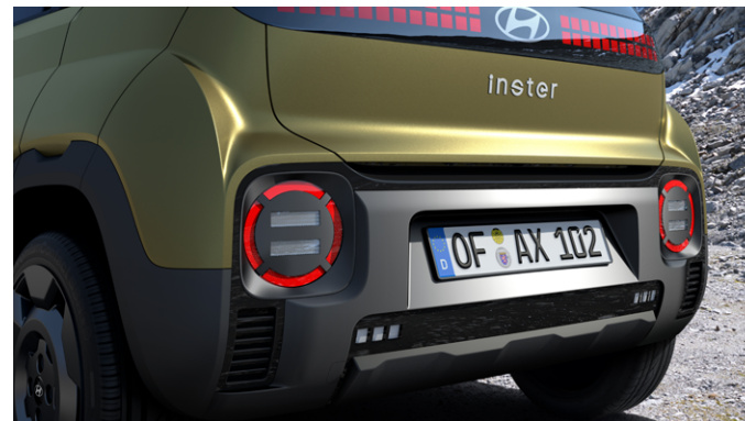
INSTER Cross hátulnézet

2025. áprilisi gyártási hónaptól az ICCB töltőkábel nem képezi a szériafelszereltség részét.