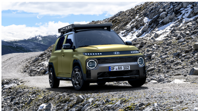
INSTER Cross, Tetőbox-szal