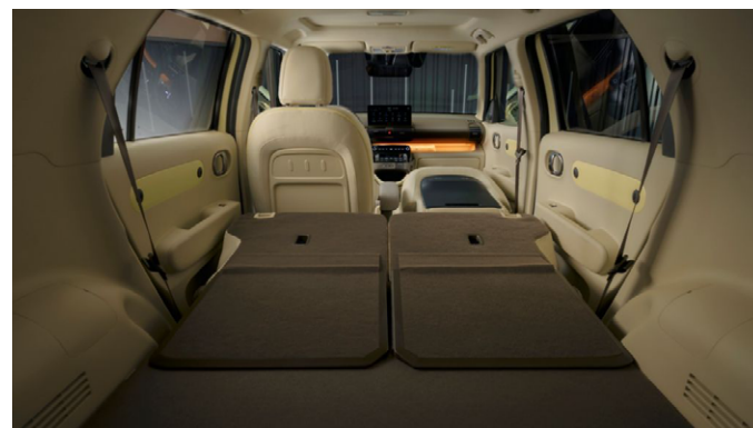
Lehajtott ülések, csomagter padlóval