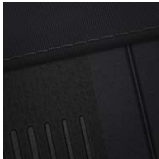
Seats Black / Black