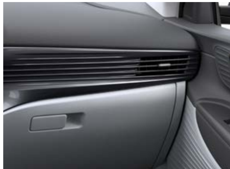
Black / Grey