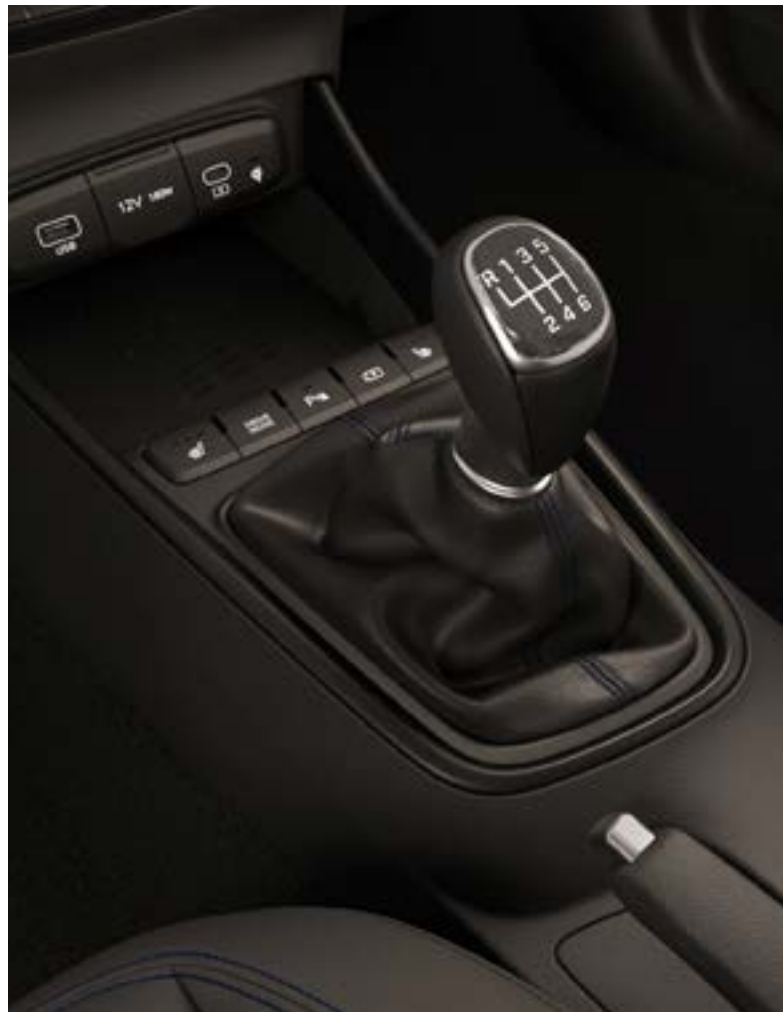
Hatfokozatú kézi kapcsolású sebességváltó.

A BAYON bámulatosan takarékos, és rendkívül kedvező CO2-kibocsátással rendelkezik.