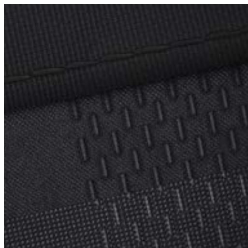
Seats Black / Grey