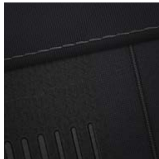
Seats Black / Grey