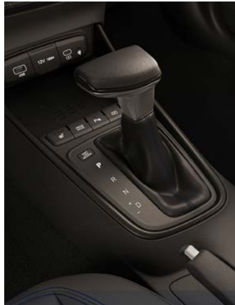
Hétfokozatú duplakuplungos sebességváltó